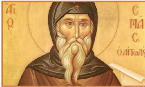
Ἀρχιμ. ΔΟΣΙΘΕΟΥ ΚΑΝΕΛΛΟΥ

Οἱ αἰῶνες πέρασαν. Φθάνουμε στὰ ζοφερὰ χρόνια τῆς Τουρκοκρατίας. Κανεὶς Ἱσαπόστολος. Ἐκτός ἐνός. Τοῦ Ἁγίου Κοσμᾶ τοῦ Αἰτωλοῦ. Ποιὸ ἔθνος ἐφώτισε; Τὸ γένος τῶν Ῥωμηῶν. Τοὺς σκλαβωμένους. Τοὺς ἐγκαταλελειμένους. Τοὺς κατατρεγμένους.